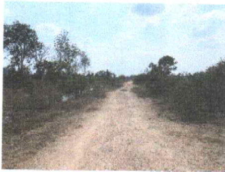
กม.ที่ ๒๒+๐๐๐