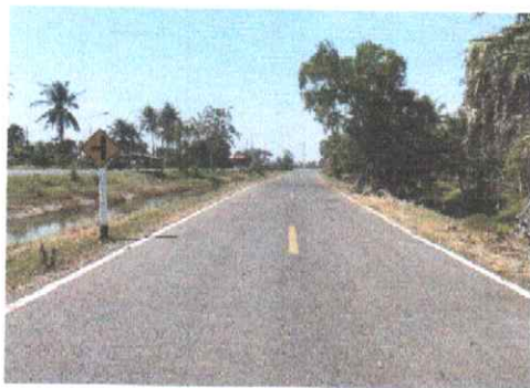
กม.ที่ ๖+๐๐๐