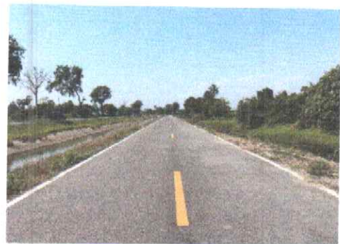
กม.ที่ ๖+๕๐๐