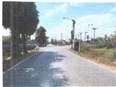
กม.ที่ ๑๑+๕๐๐