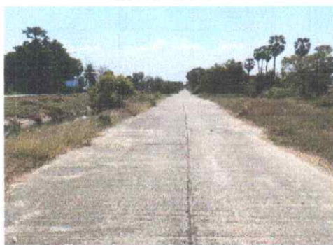
กม.ที่ ๘+๐๐๐