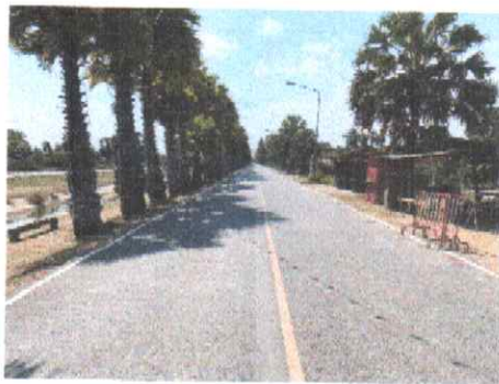
กม.ที่ ๑๐+๐๐๐