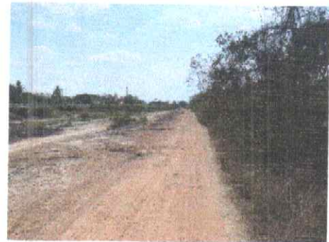
กม.ที่ ๒๒+๕๐๐