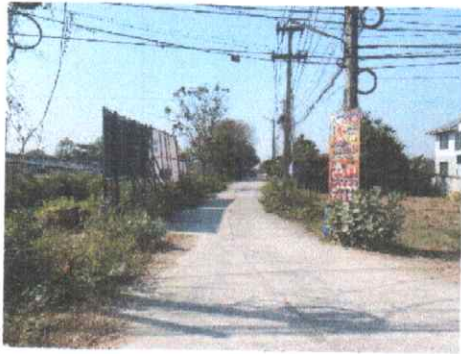
กม.ที่ ๐+๐๐๐ (จุดเริ่มต้นสายทาง)