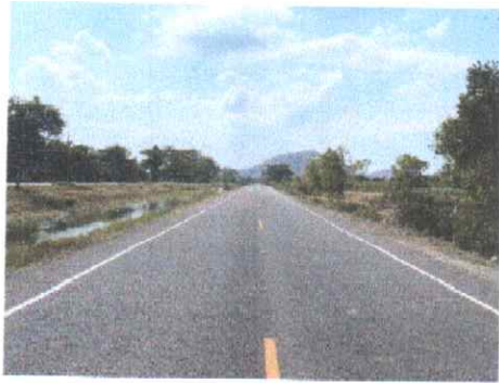
กม.ที่ ๑๗+๐๐๐