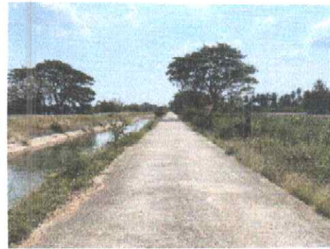
กม.ที่ ๑๕+๕๐๐