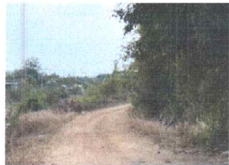
กม.ที่ ๒๔+๕๐๐