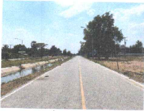
กม.ที่ ๑๓+๐๐๐