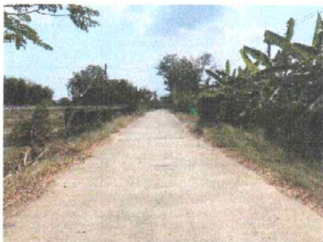
กม.ที่ ๒๐+๐๐๐