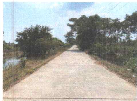
กม.ที่ ๒๐+๕๐๐