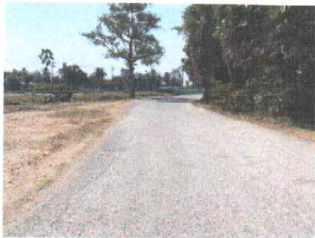
กม.ที่ ๑+๐๐๐