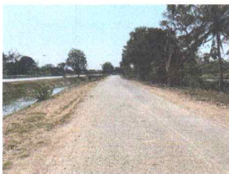
กม.ที่ ๓+๐๐๐