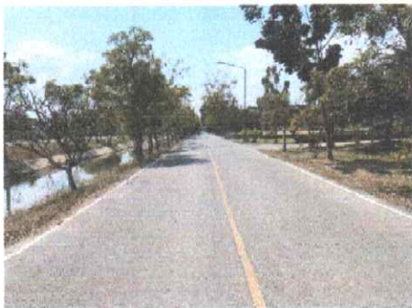
กม.ที่ ๑๒+๐๐๐