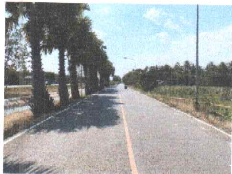
กม.ที่ ๑๐+๕๐๐