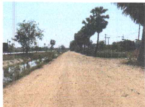
กม.ที่ ๒+๕๐๐