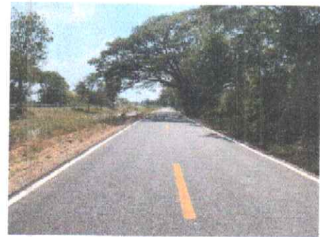
กม.ที่ ๑๘+๕๐๐