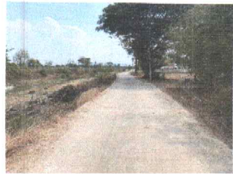
กม.ที่ ๒๓+๕๐๐