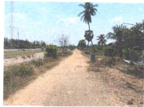
กม.ที่ ๑๔+๕๐๐