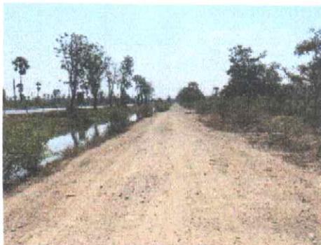
กม.ที่ ๒+๐๐๐