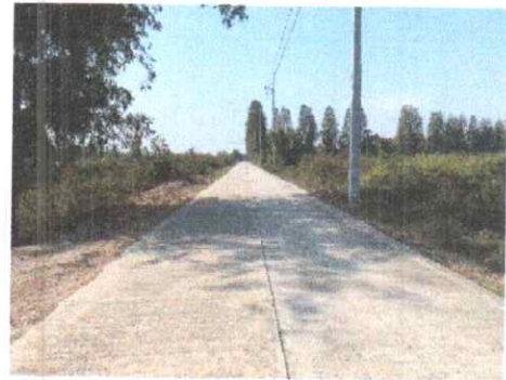
กม.ที่ ๐+๕๐๐