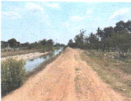
กม.ที่ ๑๕+๐๐๐