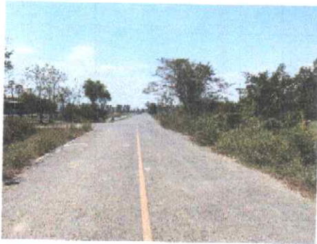
กม.ที่ ๙+๐๐๐