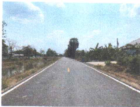
กม.ที่ ๑๘+๐๐๐