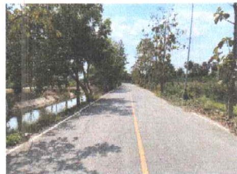
กม.ที่ ๑๒+๕๐๐