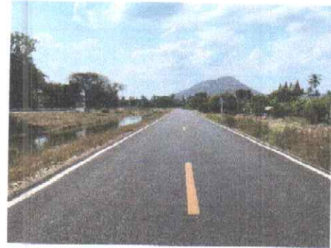
กม.ที่ ๑๗+๕๐๐