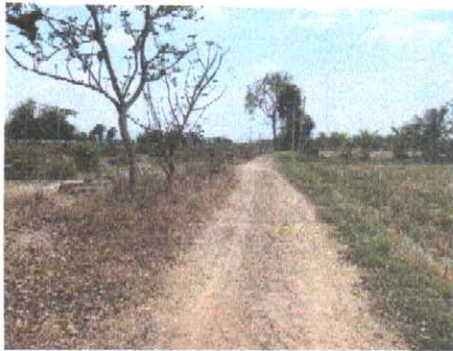
กม.ที่ ๒๓+๐๐๐