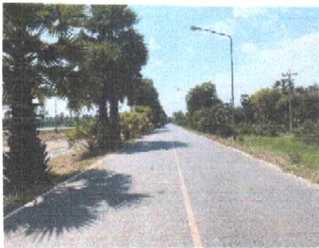
กม.ที่ ๑๑+๐๐๐