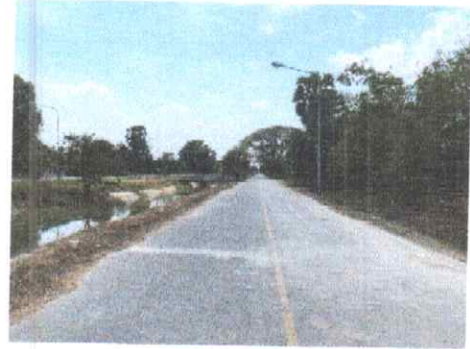
กม.ที่ ๑๓+๕๐๐