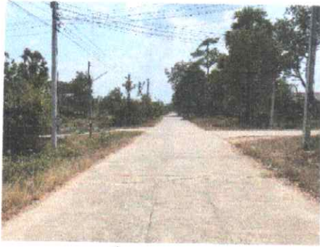
กม.ที่ ๒๑+๐๐๐