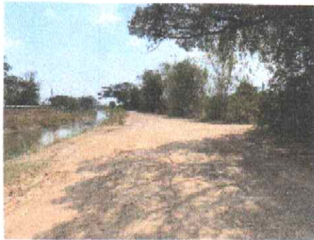
กม.ที่ ๑๙+๐๐๐