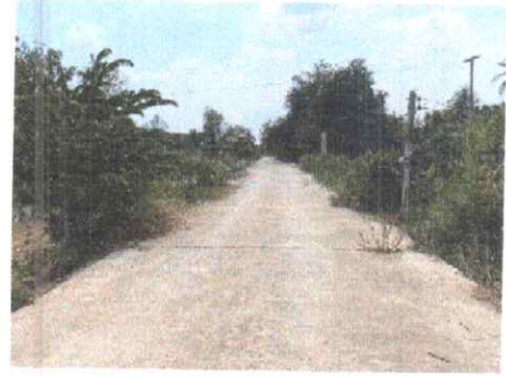
กม.ที่ ๒๑+๕๐๐