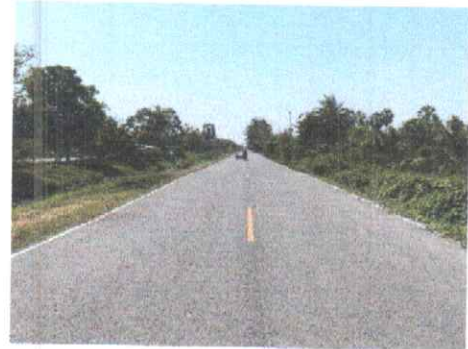
กม.ที่ ๕+๕๐๐