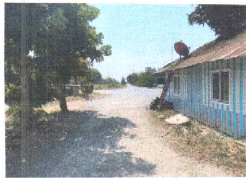
กม.ที่ ๗+๕๐๐