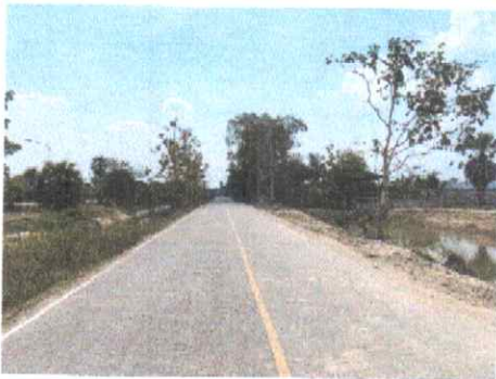
กม.ที่ ๑๔+๐๐๐