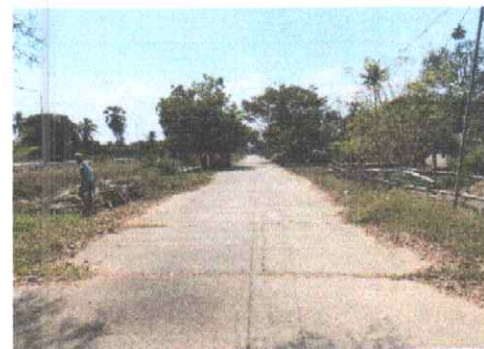
กม.ที่ ๘+๕๐๐