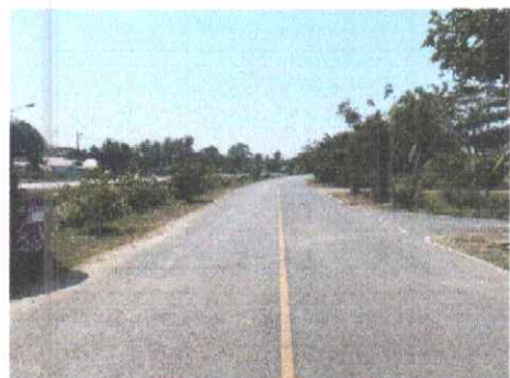
กม.ที่ ๔+๕๐๐