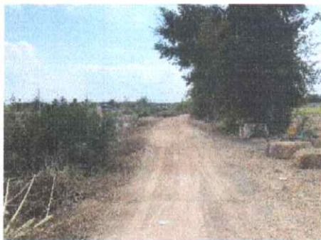
กม.ที่ ๒๔+๐๐๐