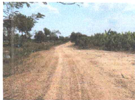
กม.ที่ ๑๙+๕๐๐