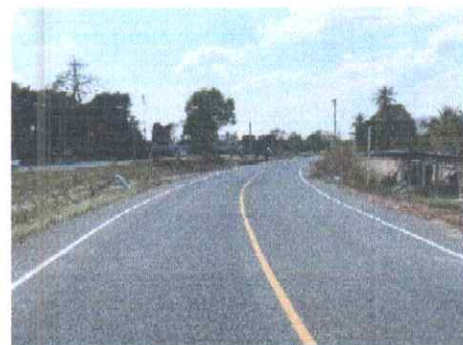
กม.ที่ ๑๖+๕๐๐