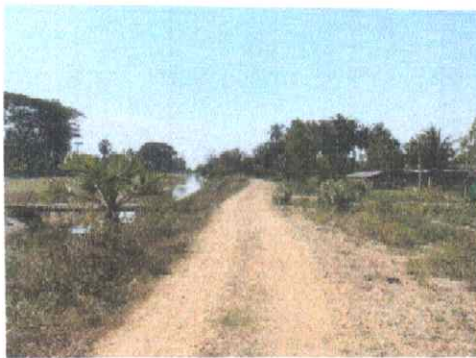
กม.ที่ ๗+๐๐๐