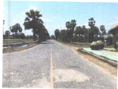
กม.ที่ ๙+๕๐๐