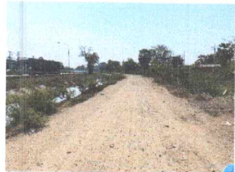
กม.ที่ ๑+๕๐๐