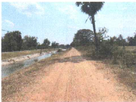
กม.ที่ ๑๖+๐๐๐