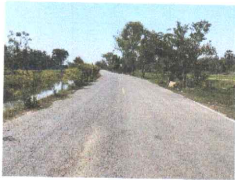
กม.ที่ ๕+๐๐๐