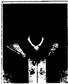
นายทะเบียนลงนามที่รูป

ให้ไว้ ณ วันที่ 6 เดือน มกราคม พ.ศ. 2550