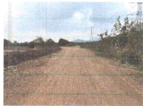
กม.ที่ ๒+๕๐๐