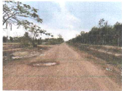
กม.ที่ ๕+๕๐๐