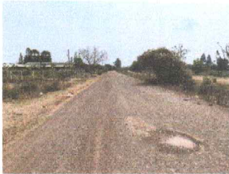
กม.ที่ ๑๕+๐๐๐