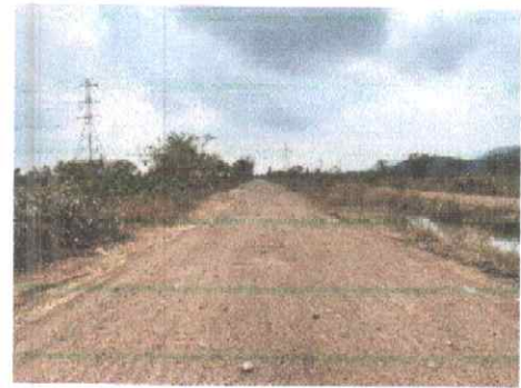
กม.ที่ ๑+๕๐๐