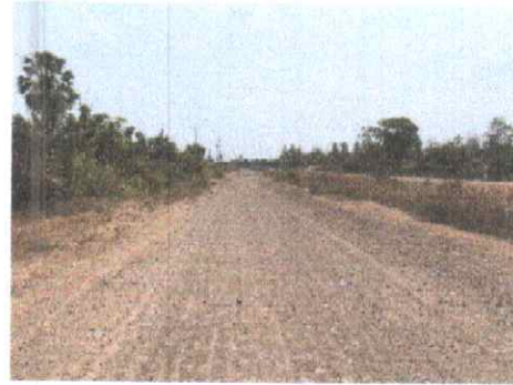
กม.ที่ ๑๓+๕๐๐