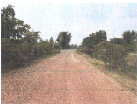
กม.ที่ ๘+๐๐๐