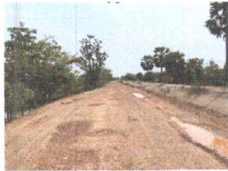
กม.ที่ ๑๖+๕๐๐