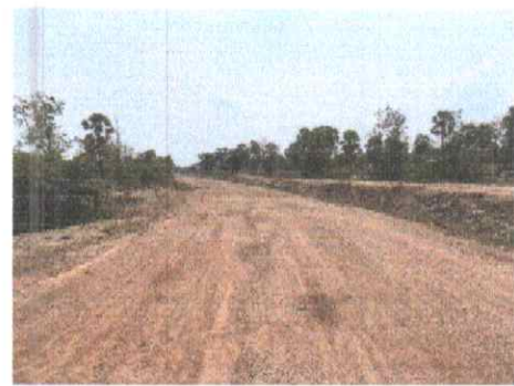
กม.ที่ ๑๑+๕๐๐