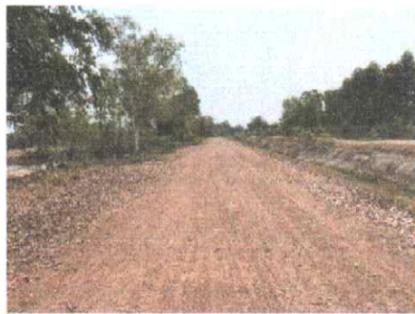
กม.ที่ ๑๒+๐๐๐