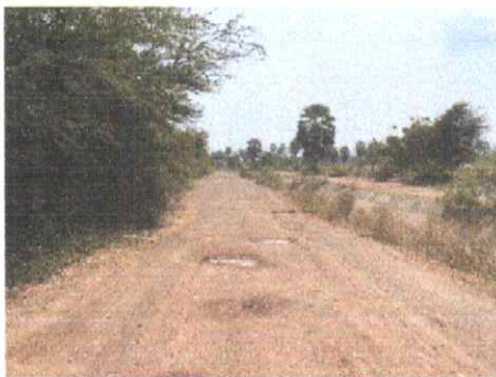
กม.ที่ ๑๖+๐๐๐