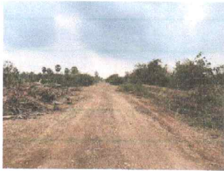
กม.ที่ ๕+๐๐๐