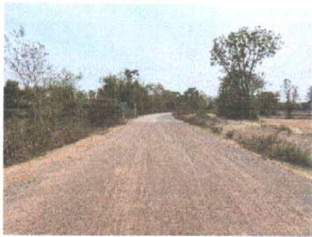
กม.ที่ ๑๘+๐๐๐ (จุดสิ้นสุดสายทาง)