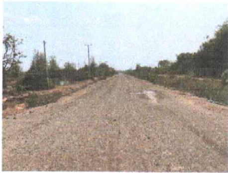
กม.ที่ ๑๓+๐๐๐