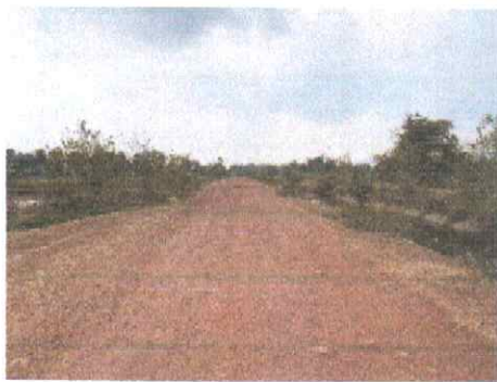
กม.ที่ ๗+๐๐๐