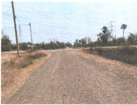
กม.ที่ ๑๔+๐๐๐