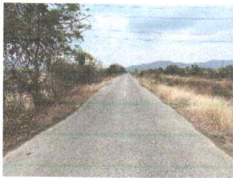
กม.ที่ ๑+๐๐๐