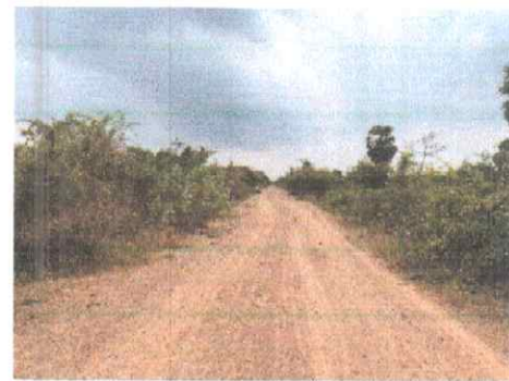
กม.ที่ ๔+๕๐๐