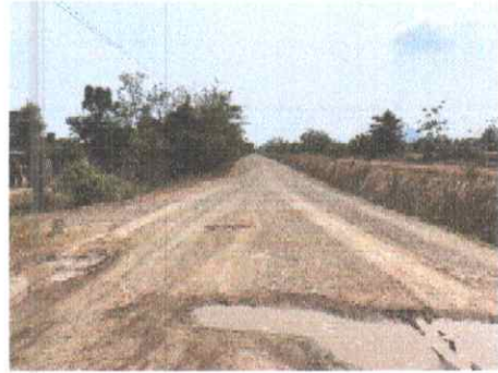
กม.ที่ ๑๕+๕๐๐