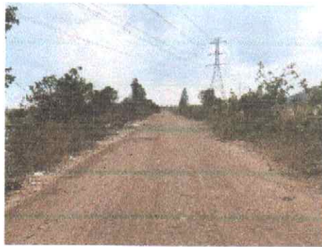
กม.ที่ ๒+๐๐๐