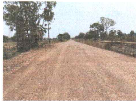
กม.ที่ ๑๔+๕๐๐