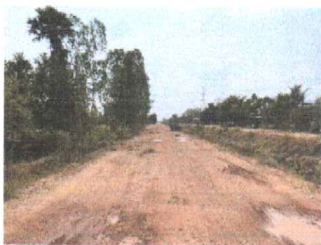
กม.ที่ ๑๐+๐๐๐