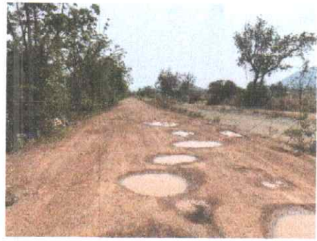
กม.ที่ ๑๗+๕๐๐