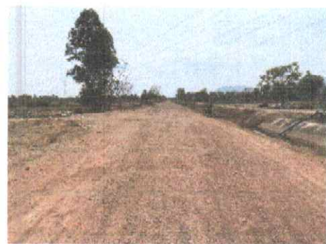
กม.ที่ ๑๐+๕๐๐