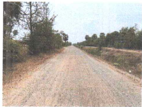
กม.ที่ ๙+๕๐๐