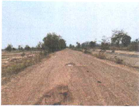
กม.ที่ ๑๗+๐๐๐