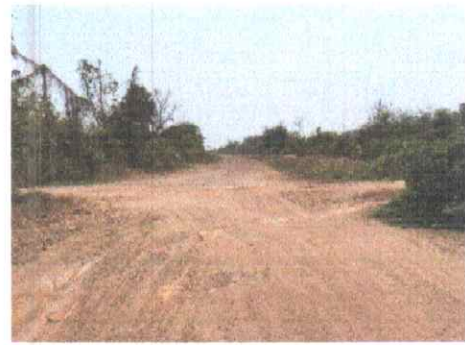
กม.ที่ ๑๒+๕๐๐