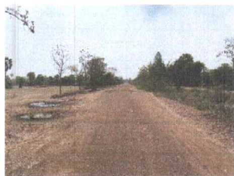
กม.ที่ ๘+๕๐๐