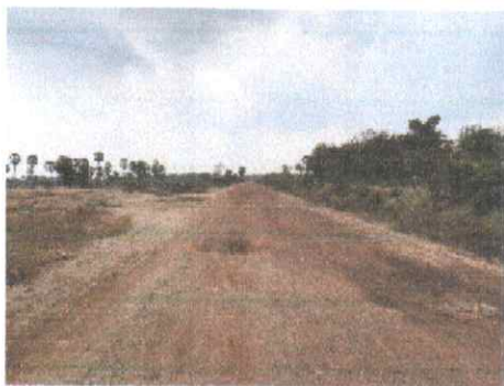
กม.ที่ ๖+๐๐๐