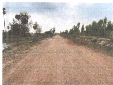
กม.ที่ ๖+๕๐๐