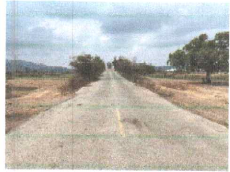
กม.ที่ ๐+๕๐๐