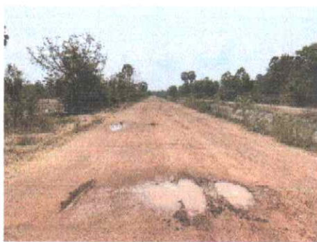
กม.ที่ ๑๑+๐๐๐