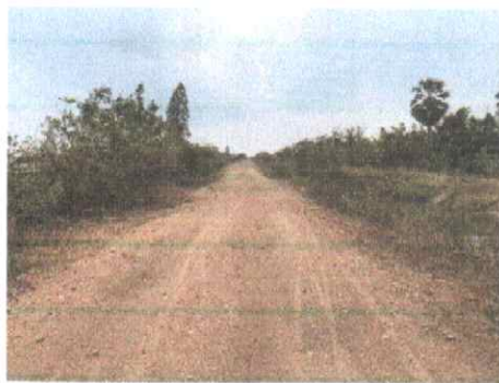
กม.ที่ ๓+๐๐๐