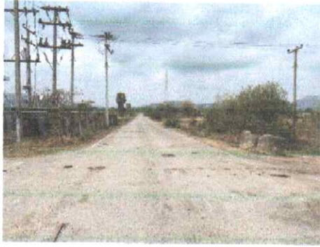
กม.ที่ ๐+๐๐๐ (จุดเริ่มต้นสายทาง)