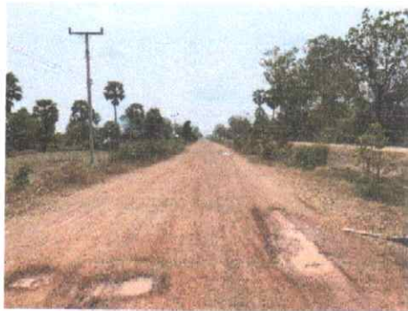
กม.ที่ ๙+๐๐๐