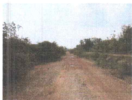
กม.ที่ ๗+๕๐๐